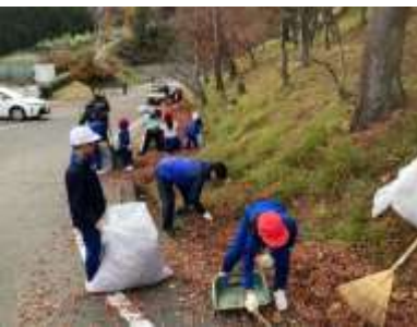
汗をかきながら頑張りました

が11月 25日(月)午後2時から全 児童、職員、地区住民の方 で実施されました。学校周 辺がとてきれいなになり ました。実施後、地域の方 が「気持ちか穏やかにな る。」と教えてくださり、 校長先生は「応援してくだ さる多くの方を忘れず、あ いさや元気に頑張る姿 で返しましょう。」とお話 しました。