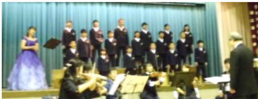
全員でコンサート楽団との合唱