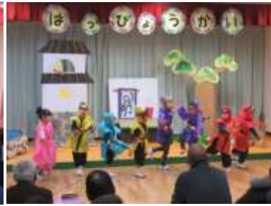
元気一杯のなかよし忍者隊