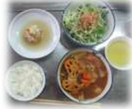
前回の料理は根菜カレ ースープ、大根サラダ、 里芋まんじゅうなど

8回目 12月24日(火)9:30~ お正月料理に挑戦!かまぼ こ飾り、栗きんとん、だし巻き、 煮しめ、紅白なます、ケーキ 9回目 翌年1月24日(予定)