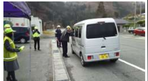
上豊松コミセンにテント村を開設