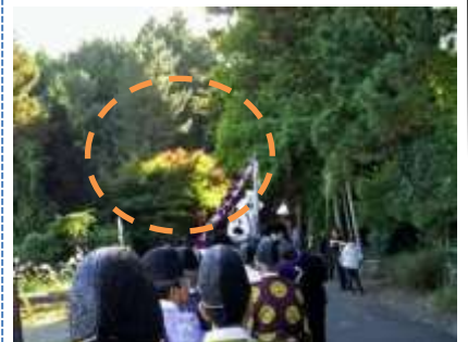
お旅に神秘的な日差しが出現

携帯・スマホを使用しな がらの運転などは法に触 れることになり、点数等 が増えました。また、「あ おり運転」は厳しい罰則 に科される情報がありま す。重大事故に繋がります。 精神的な余裕を持つ て運転してください。