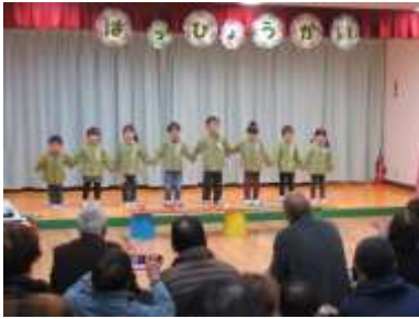
とよまつ子大きく育ってね!

が12月7日(土)午前9時 からとよまつ保育所で開催 されました。全園児11名が 「うれしい」「きもちい い」「かっこいい」を3つ の「い」をテーマに元気に 楽しく演技しました。乳児 たち(3歳)は「おまつりこ っこ」などで頑張りました。 孫達を見るおじいちゃん・ おばあちゃんは可愛い子ど もたちを見てほほえましい 笑顔になり心が癒されまし た。今度は皆さんもどうぞ。