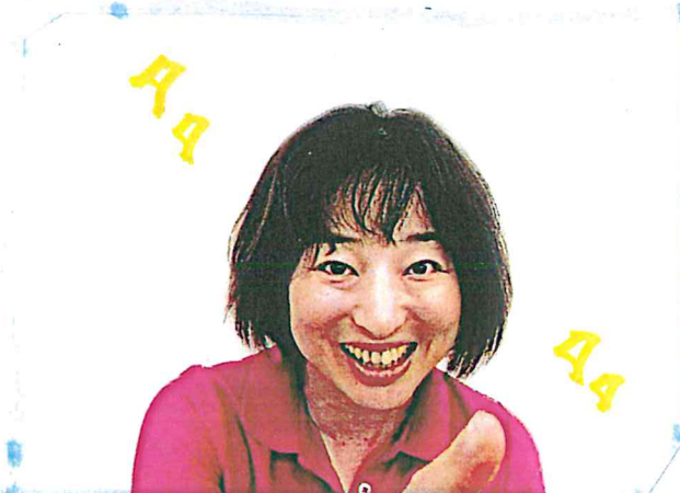
とても素敵な笑顔、いただきました!!