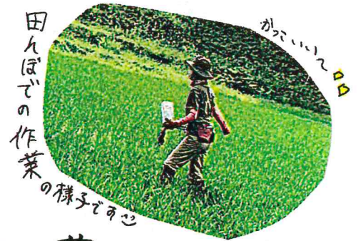
田んぼでの作業の様子です。