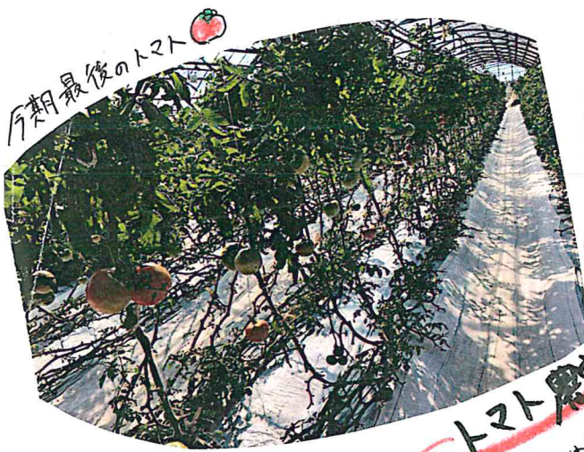
今期最後のトマト