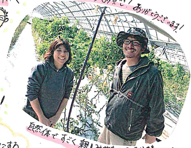
自然体で、おどろき親しみやすいあたたか さを感じました♡

私はとにかく 家でのんびり過ごることが幸せで、 冬は1人の時間を満喫しています お互いのハウスを大事にしながら、これが楽しんでいます!