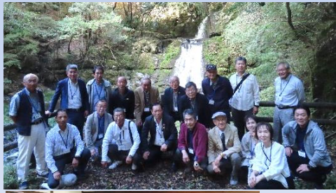
「昔は歩いて遊びにきたなあ」 「滝つぼへ飛び込んだらなあ」 「子どもだけでも来たよな」