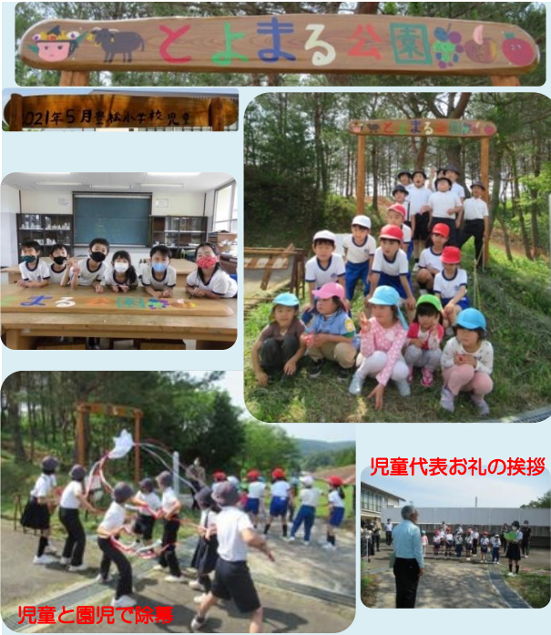
児童代表お礼の挨拶