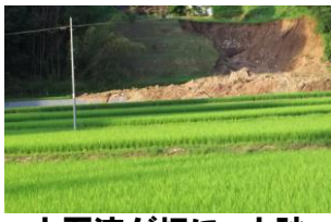
土石流が畑に、土砂崩れが田を覆う