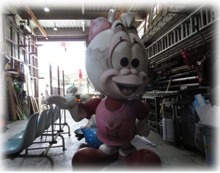
ポッポとクック(写真)はアジア大会のマスコット

「とよまつプラザ21」の再生計画に基づき、空き店舗を活用した「昭和のおもちゃ館」(仮称)を創設し、昔懐かしいおもちゃを展示することになっています。 プラザ21が生まれ変わり、新たな賑わいを取り戻してくれることでしょう。