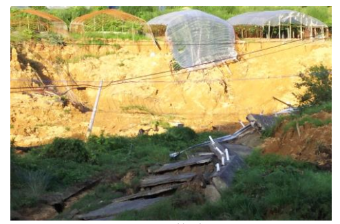
土砂崩れにより道路寸断、断水、電柱、ハウス、農地など被害

7月5日から7日と3日間 にわたつての集中豪雨は、豊松地区にも大きな被害をもたらしました。この集中豪雨は、土砂崩れ等による家屋の損壊、道路の破壊、農地への水害、山林の土砂崩れ等、多くの被害(170件・8日現在)がありました。被害を受けられた方に、心よりお見舞い申し上げます。 インフラ整備をいち早く実施し、元の生活が送れるよう復旧作業が進められています。