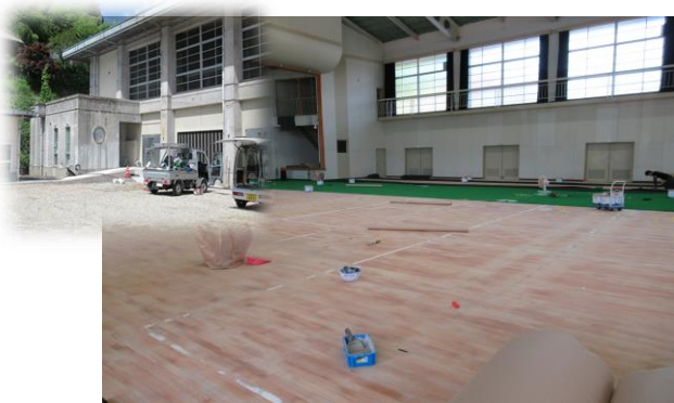
トイレ改修(左上)と人工芝の床

これにより、グラウンドゴルフ、野球、サッカーなどの練習場、イベントなどに使用できます。