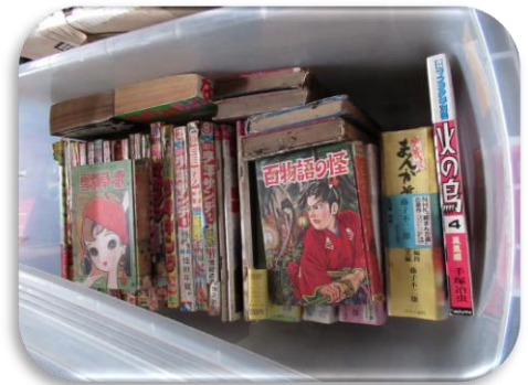
戦後の懐かしいマンガ本