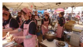
輝いているメンバー

活動を通して、郷土料理を学び、また、主に女性ならではのアイディアを採用しているところから「色彩」倶楽部と名称が決まりました。ー倶楽部の良き将来の活動はー 高齢者から多くの知恵をもらい、活動を通して、若い人とのつながりができ、女性が地域で輝いているところです。