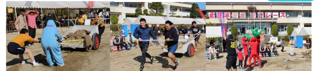
砂場にはまってさあ、大変