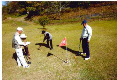
一喜一憂の真剣勝負が楽しい

高齢者を対象にした地域サロンは、健康長寿と安心安全な生活を確保するため、折り紙の作製、防犯・防災交通安全などの教室を開催しています。楽しい集いの場に努めています。当地域には整備されたグラウンドゴルフ場があります。健康のために多くの方が毎日練習していま