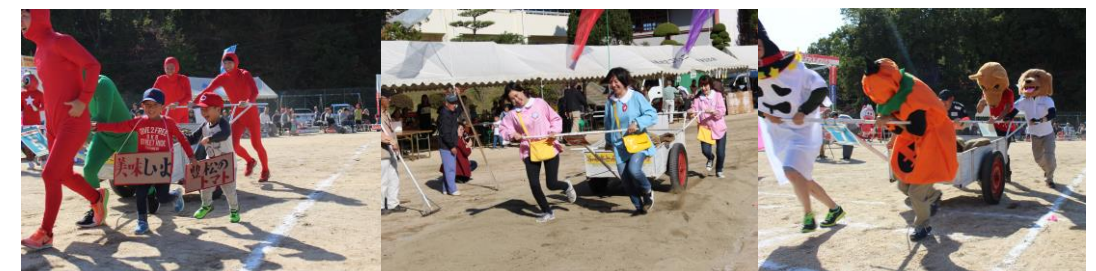
ちびっ子助っ人が豊松トマトのPR