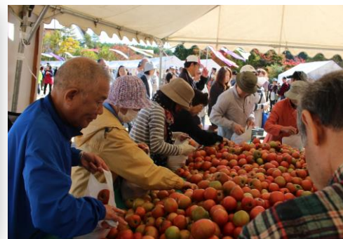
←トマト詰め放題に長蛇の列 大人気