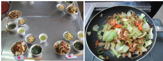
10月の料理:スタミナ丼ぶり、はるさめ酢の物など

9回目 12月20日(木) 9:30～ ケーク・サレ、チキンのおかず、 ラタ、かぶのスープなど