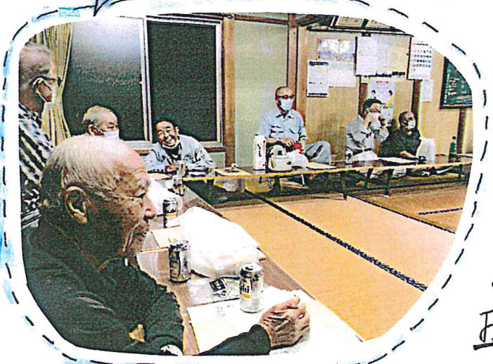
まるで日本史の授業のように、 日ノ郷の歴史を交遊と教えて いただきました。