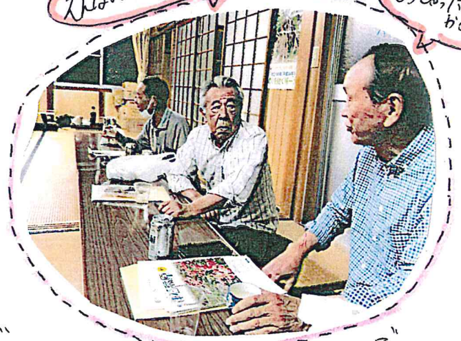
改めて、想いを語り合うことで 斬新な情報交流が ございました。