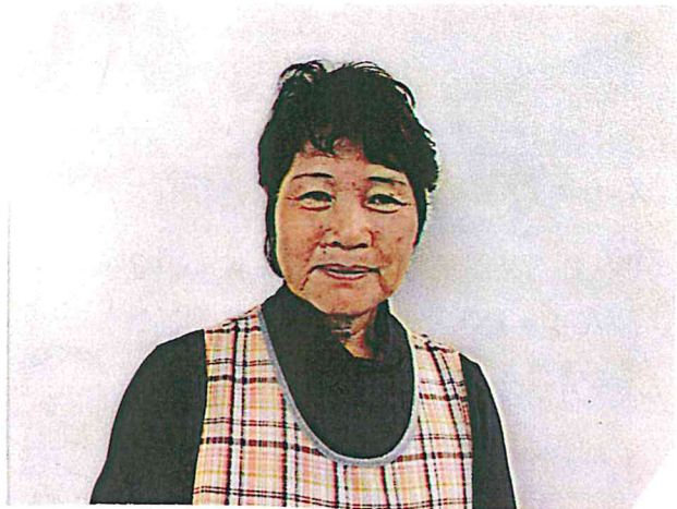
ぶどう。作業後にもかわらぬ。快く写真と撮らせて くださりました。