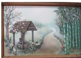
☆マンサクの花咲く頃☆