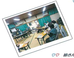
皆さん、真剣そのもの。黙々と作品にむかって♡♡

「無理のない見守り」については振興会や班単位で話してもらい、ルール化してもらえば良いのではないか。