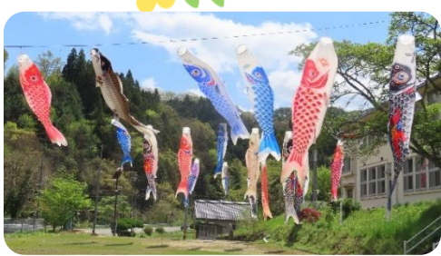
(上豊松コミュニティセンター:4月25日) 「久しぶりに晴れたね~」「さうだね太陽が眩しいよ!!」 「いい風が来たら みんな一生懸命に泳ごう!!!」

豊松の春を紹介します。(左:水仙公園・真中:米見山 右上:水仙ロード 右下:追谷稲)